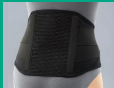
体幹用サポーター マックスベルト